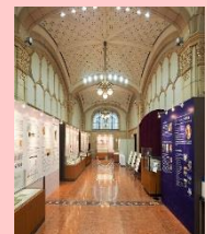
メモリアルホール