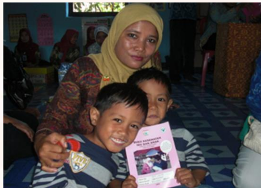
ピンク色のインドネシア版母子手帳を大切にしている子どもと家族。(2010年：インドネシア・ロンボク島)