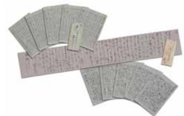
広岡浅子直筆の書簡〔複製〕