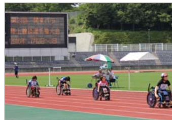
第21回関東パラ陸上競技選手権大会の様子