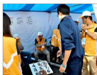
第15回全国障害者スポーツ大会「紀の国わかやま大会」(平成27年10月開催)の様相