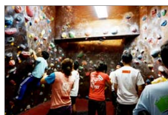
③モンキーマジック