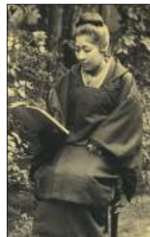
▲ 広岡浅子 (1849～1919)

なお、広岡浅子は平成27年度後期連続テレビ小説「あさが来た」（NHK）のヒロインのモデルとなりました。