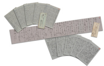
▲ 広岡浅子直筆の書簡〔複製〕