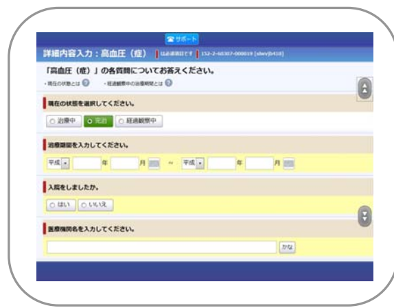
【病名ごとに必要な質問を自動的に表示】