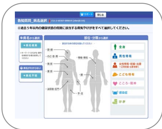
【人体図のイメージから病名を選択できる】