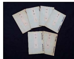
▲浅子直筆の和歌草稿集