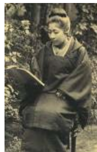
▲ 広岡浅子 (1849～1919)

なお、広岡浅子は平成27年度後期連続テレビ小説「あさが来た」（NHK）のヒロインのモデルとなりました。