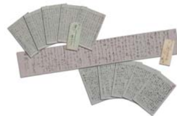
▲ 広岡浅子直筆の書簡[複製] (所蔵：日本女子大学)