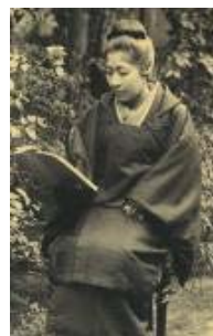
▲ 広岡浅子 (1849~1919)

なお、広岡浅子は2015年度後期連続テレビ小説「あさが来た」（NHK）のヒロインのモデルとなりました。