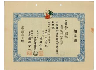
▲ 日本女子大学校 設立寄付領収書