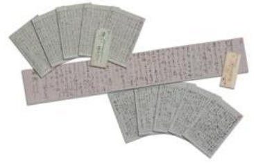
▲ 広岡浅子直筆の書簡[複製]