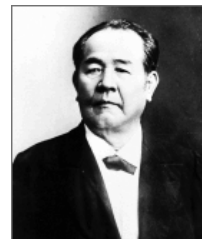
▲ 渋沢栄一 (1840～1931)