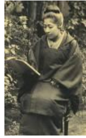
▲ 広岡浅子 (1849~1919)

なお、広岡浅子は2015年度後期連続テレビ小説「あさが来た」（NHK）のヒロインのモデルとなりました。