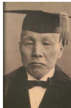
▲ 大隈重信 (1838～1922)