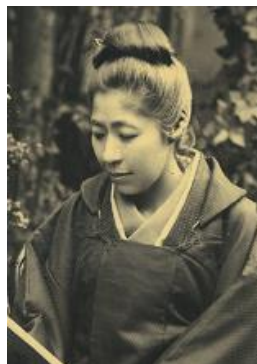
▲ 広岡浅子 (1849～1919)

本企画では、広岡浅子の生涯を紹介するとともに、浅子と大隈重信の女子教育についての関わり、そして浅子が立て直した江戸時代の豪商・加島屋と佐賀藩の関わりなどをご紹介します。この機会にぜひご来場ください。