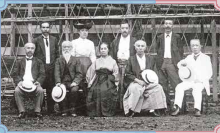
評議員の記念撮影