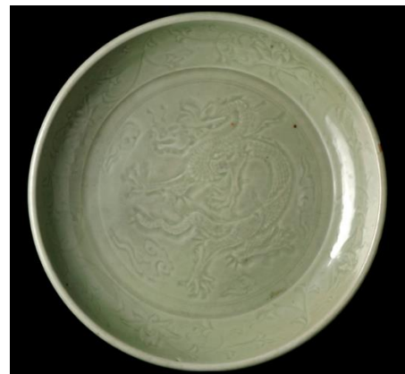
青磁大鉢（中国・龍泉窯／14世紀頃）

また、1868（明治元）年に長州藩主から加島屋に下賜されたものであることが、調査の結果、確認されました。本企画では、青磁大鉢の初公開を通じて、激動の幕末に大坂の豪商がどう立ち向かったのか、歴史ドラマの一端を紹介します。この機会にぜひご来場ください。