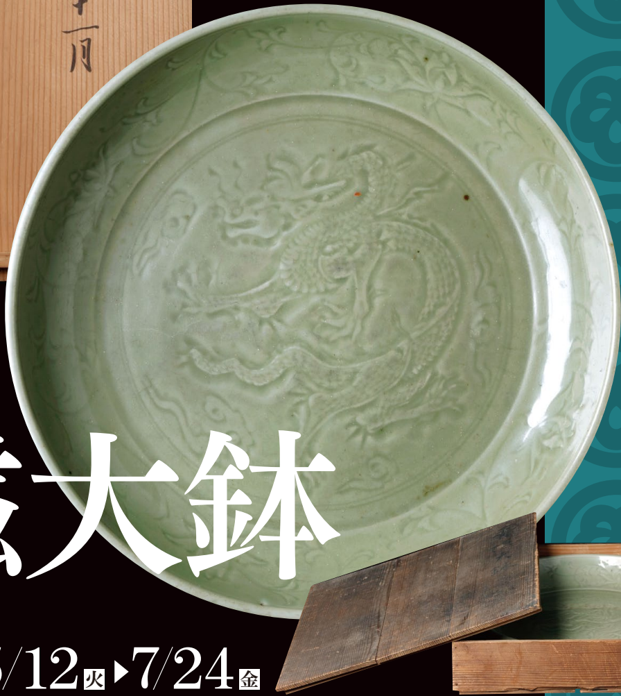
(上) 青磁大鉢 (下) 箱と青磁