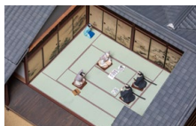
加島屋本宅模型 奥座敷