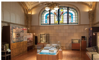
特別展示会場 大阪本社メモリアルホール