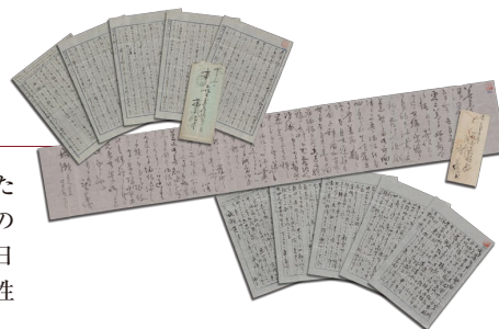
浅子が成瀬仁蔵に宛てた直筆の書簡【複製】

2015年に放送された連続テレビ小説「あさが来た」(NHK)の主人公モデルとなった彼女の生涯と活躍、人となりなどを詳しくご紹介しています。